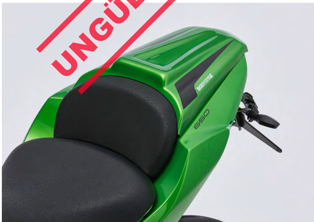
Kawasaki Z 650