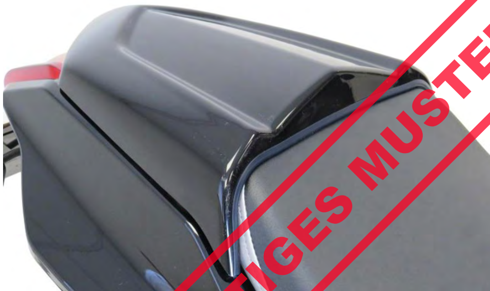
Suzuki GSX S 1000 S Katana