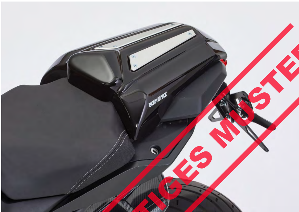
Honda CB 650 R Neo Sports / Sports