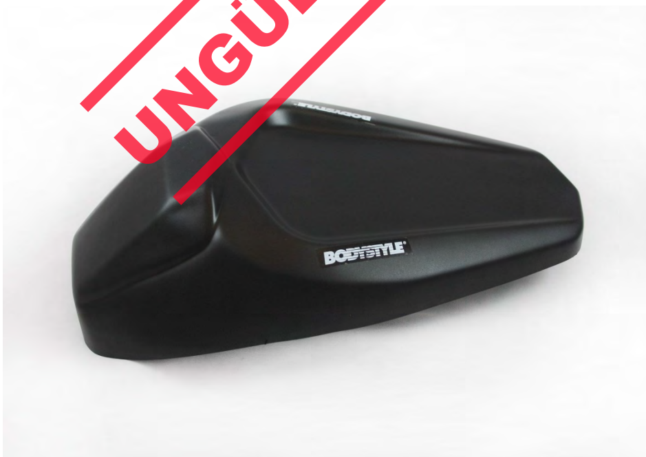
Kawasaki Z H2