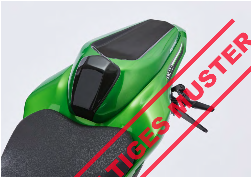
Kawasaki Z 900