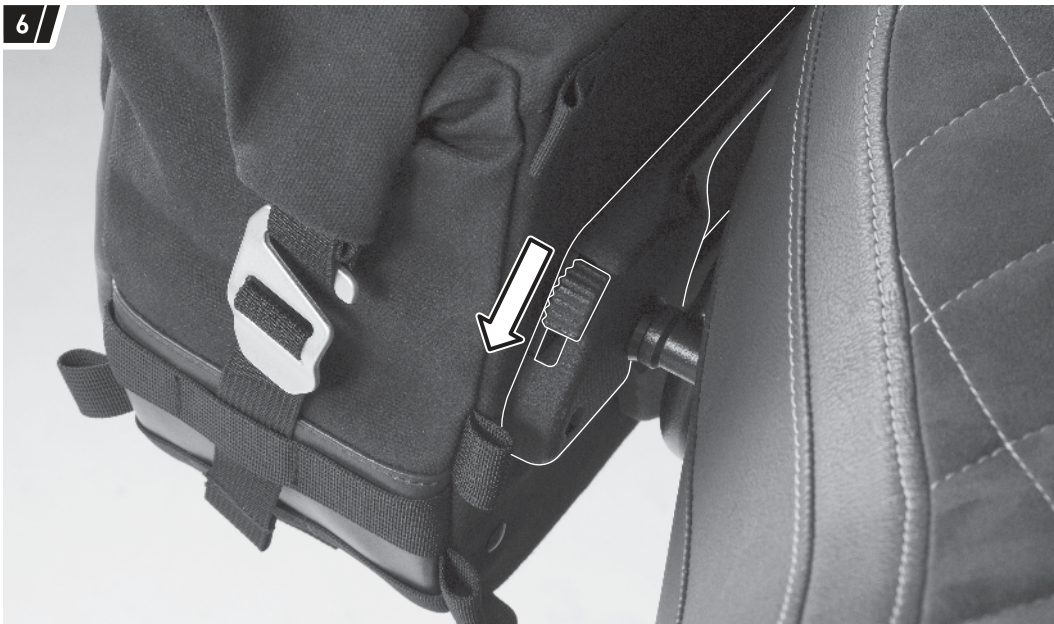
Befestigung und Fahrzeug dienen als Beispiel. / Fixation and vehicle are examples.

Drücken Sie zum Entriegeln der Seitentasche (1a/1b) einfach den gezeigten Schieber des Verschlussmechanismus nach unten.